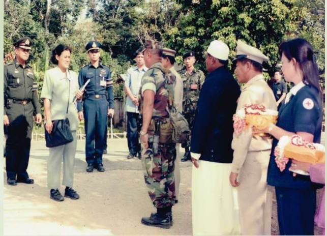
เสด็จ ฯ เมื่อวันที่ 18 กุมภาพันธ์ 2547