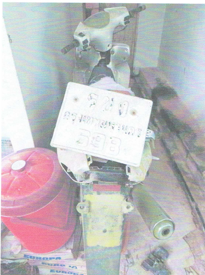
รถจักรยานยนต์ ยี่ห้อแอ๊ดดีทอนี่ม รุ่น COOL TOWN ๑๒๕ หมายเลขทะเบียน รขง ๖๙๘ กรุงเทพมหานคร